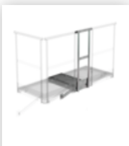
Plate-forme d'extension 1000 x 1000 mm