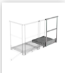
Plate-forme d'extension 800 x 800 mm