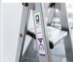
Plate-forme de base 1 000 x 1 000 mm