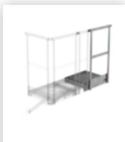
Plate-forme d'extension 400 x 800 mm