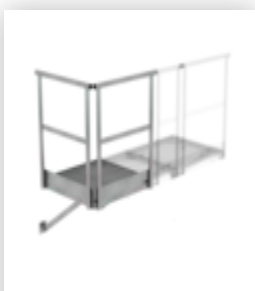
Plate-forme de base 800 x 800 mm