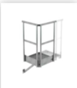
Plate-forme d'extension 500 x 1000 mm